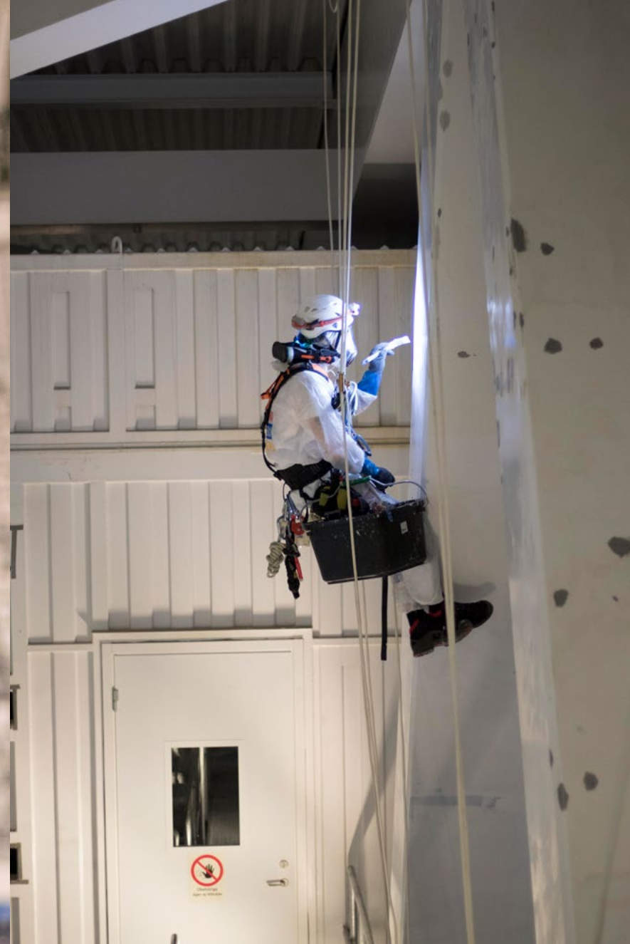
PÅ TELE2 ARENA FRÄSCHAR VI UPP ROSTSKYDDET AV STÅLBJÄLKARNA PÅ 40 METERS HÖJD.

Klättringsmålning istället för dyr byggställning