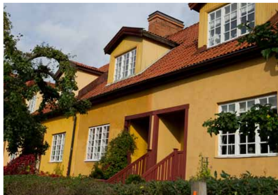
OLIKA NYANSER AV OCKRAGULT HITTAR MAN BLAND NÅGRA AV SVERIGES FÖRSTA RADHUS SOM BYGGDES 1908 PÅ CANADASTIGEN PÅ LIDINGÖ. ALLA RADHUS ÄR OCKRAGULA, MEN GRANNARNA VERKAR INTE KUNNA ENAS OM VILKEN GUL KULÖR MAN SKA VÄLJA.