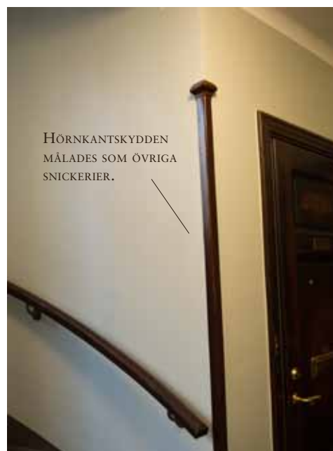
HÖRNKANTSKYDDEN MÅLADES SOM ÖVRIGA SNICKERIER.