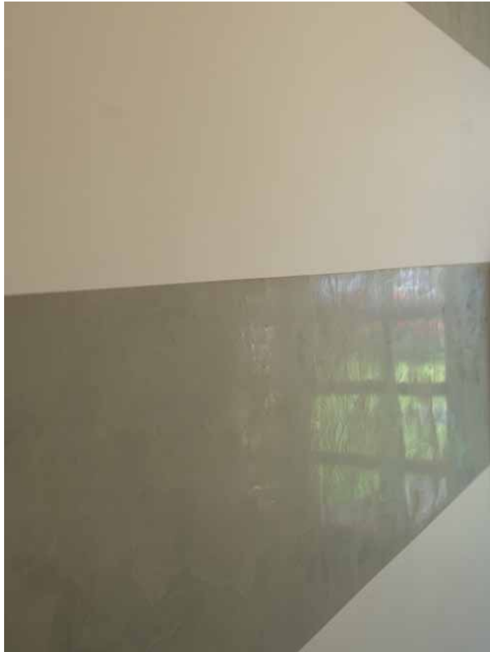
I ENTRÉN KOMBINERADES EN MATT VÄGGFÄRG MED EN MÖRKARE BLANK STUCCO, TON I TON.

I oktober var väggarna svarta. Månaden innan var väggarna målade i regnbågens färger – för att det passade bäst till den utställningen.