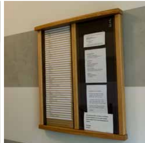
NYA TRAPPREGISTER MED ANSLAGSDEL TILLVERKADES I EK, PRECIS SOM ENTRÉPORTEN.