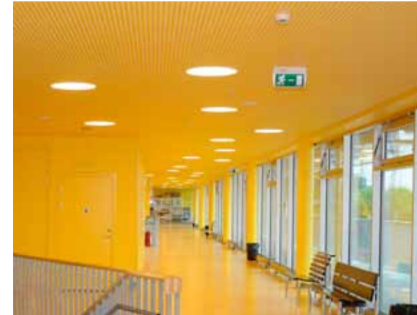
PÅ ÄLVSTRANDENS BILDNINGSCENTER I HAGFORS ÄR ALLT GULT: GOLV, VÄGGAR OCH TAK.