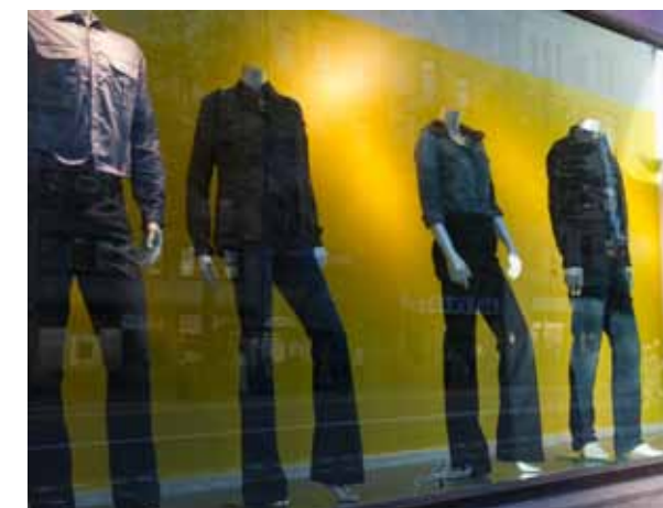
GULT ÄR EN SIGNALFÄRG – TILL EXEMPEL I SKYLTFÖNSTER.