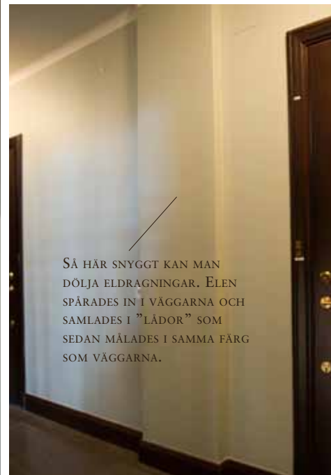
SÅ HÄR SNYGGT KAN MAN DÖLJA ELDRAGNINGAR. ELEN SPÅRADES IN I VÄGGARNA OCH SAMLADES I "LÅDOR" SOM SEDAN MÅLADES I SAMMA FÄRG SOM VÄGGARNA.