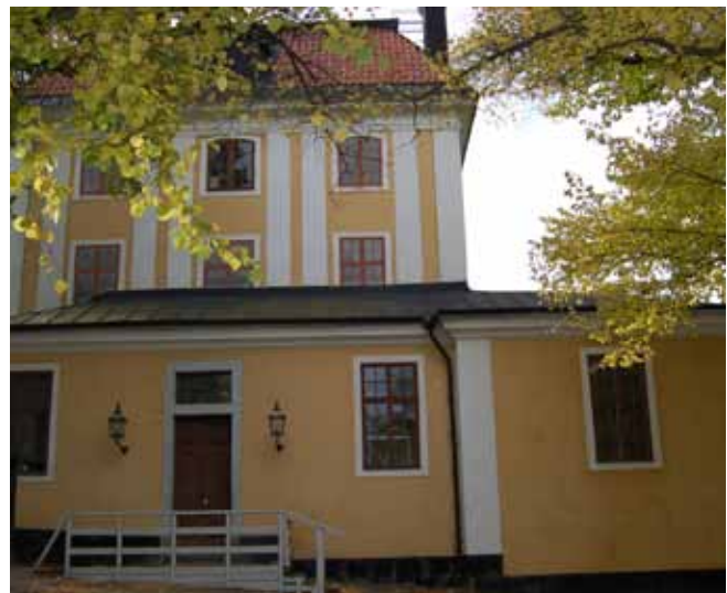
BILDERNA OVAN ÄR TAGNA PÅ DJURGÅRDEN OCH PÅ ULRIKSDALS SLOTTSSOMRÅDE.