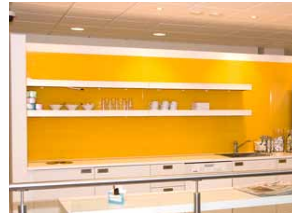
I VATTENFALLS KONTOR PÅ STUREGATAN/HUMLEGÅRDSGATAN HAR EN VÄGG MÅLATS INTENSIVT GUL.