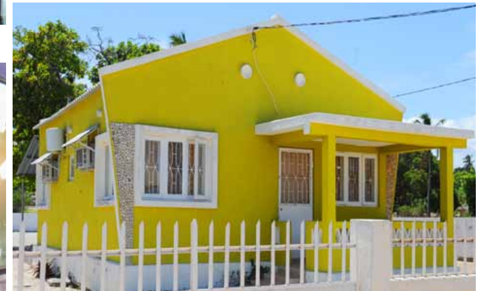
60-TALSHUS I MOÇAMBIQUE – ALLA GULA KULÖRER ÄR MÖJLIGA ATT FÅ FRAM MED MODERNA PIGMENT.