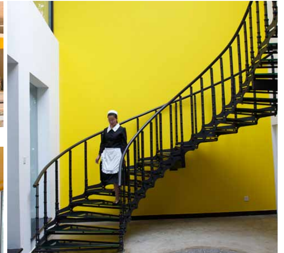
I EN DANSK RESTAURANG I BEIJING FINNS DENNA KNALLGULA VÄGG.